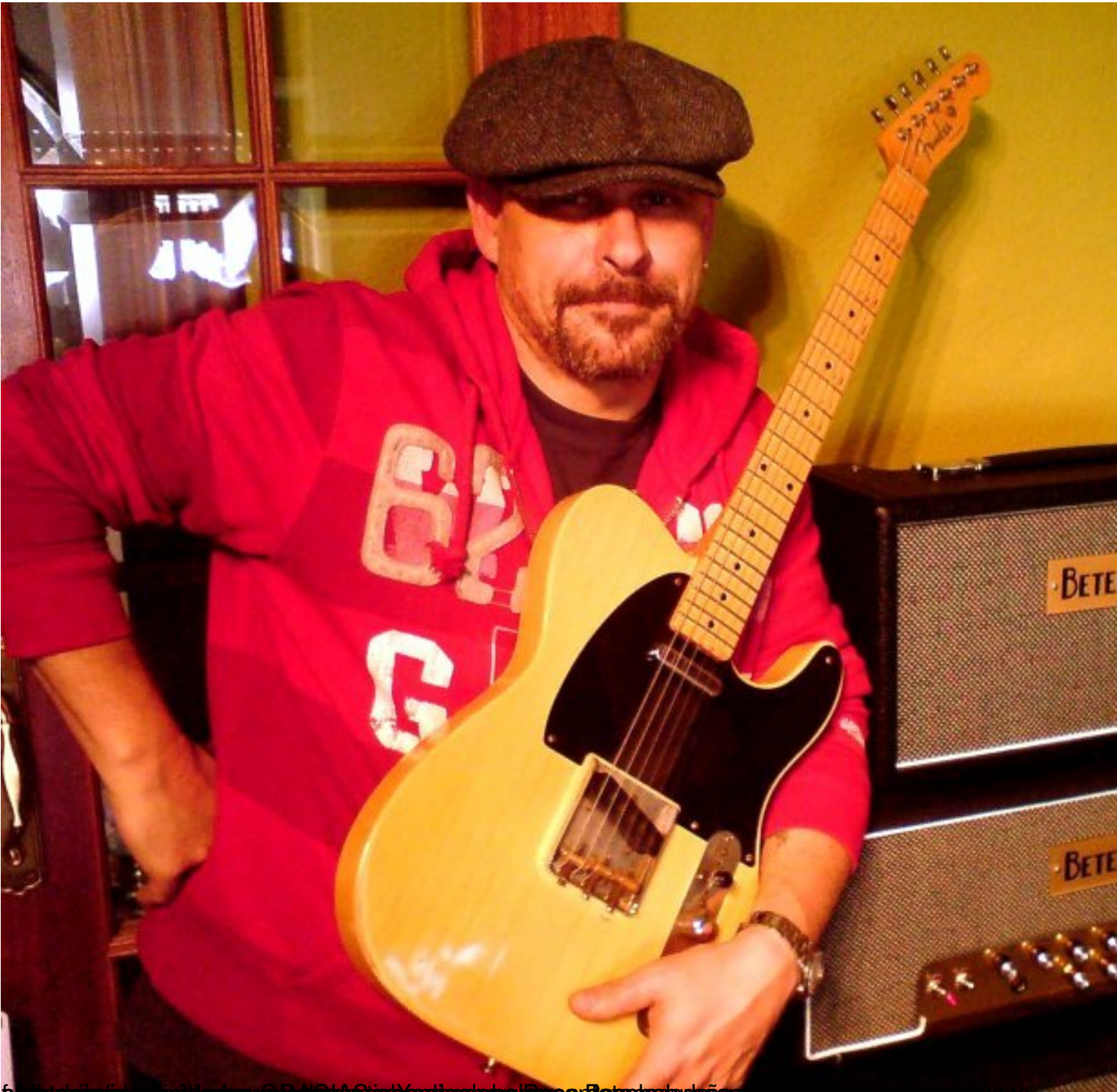
Figura más prominente en el mundo de la música en Chile. Ha sido el primer guitarrista en usar una guitarra eléctrica

Jueves, 05 de Febrero de 2009 00:49 - Actualizado Sábado, 07 de Febrero de 2009 20:20